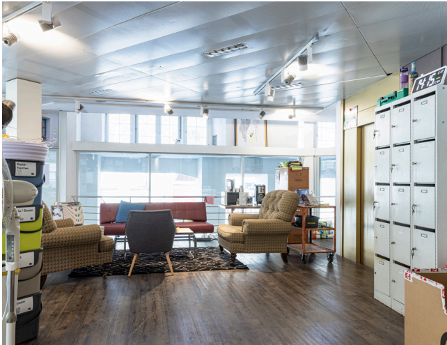
Die gemütliche Kaffeeecke lädt zum Verweilen ein.

«Hier finden alte Kulturtechniken, wie Stricken oder Holzschnitte, genauso Platz wie Skizzen im virtuellen Raum mittels der Virtual-Reality-Brille.»