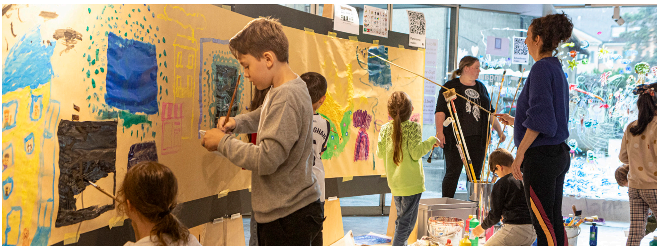
«Malen für Alle» während den Aktionstagen Behindertenrechte im Juni 2024.

Neuhausen. Unsere beiden Angebote für den Ferienpass fanden regen Zuspruch. An jeweils zwei Tagen bemalten die jüngeren Kinder die Schaufenster des ehemaligen Modehauses und die älteren Kinder und Jugendlichen traten mit selbstgebaute Bildträgern gegen die künstliche Intelligenz an. Bewaffnet mit Pinsel und Gouachefarbe entgegneten sie der KI ihre künstlerische Intelligenz und erkannten spielerisch, dass die KI stets von der menschlichen Kreativität zehrt.