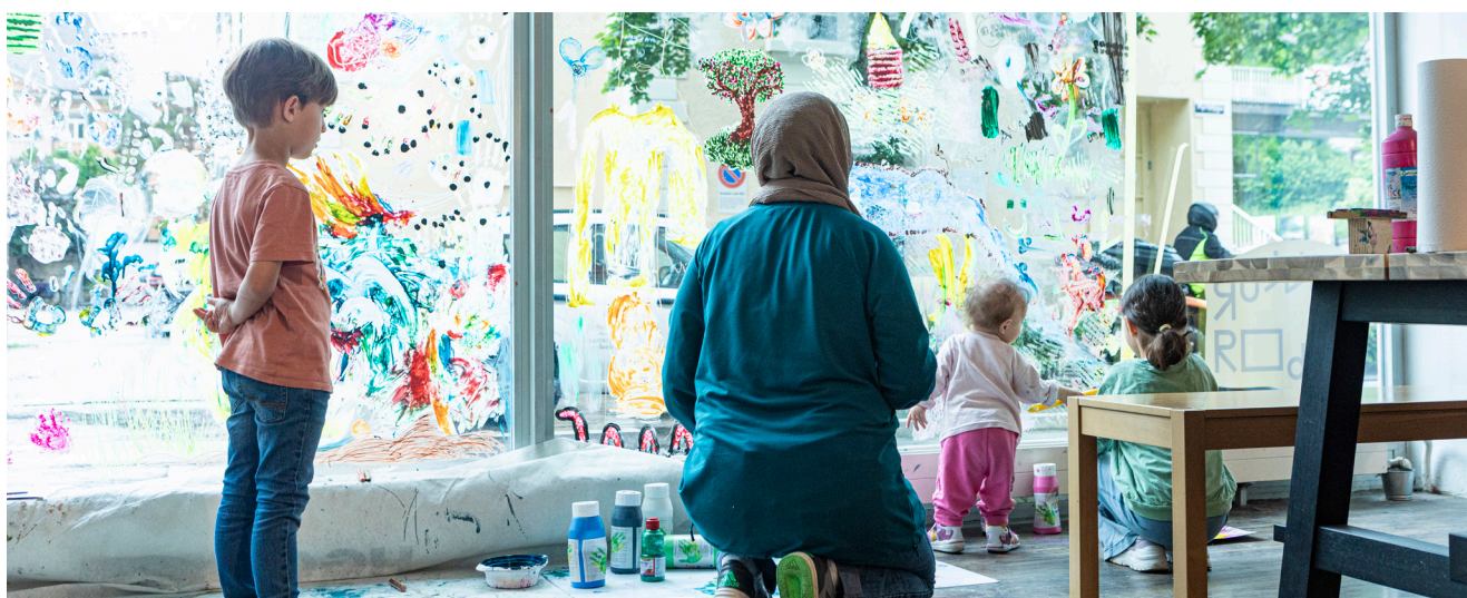
Gerne werden für unsere Elki-Ateliers auch die Schaufenster als Bildträger genutzt.

che Rolle Masken und Kostüme in ihrer Religion, Tradition oder Festivitäten spielen. So erschliessen wir uns diese ursprüngliche und wohl auch universelle Lust des Verkleidens und des Rollentauschs gemeinsam neu.